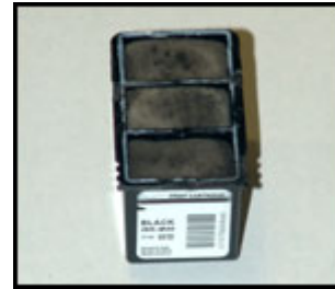
Cartuccia senza tappo con spugne Notare le 3 "camere" separate