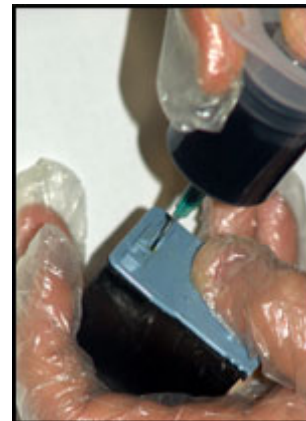
Ricarica dell'inchiostro... Ricaricare sempre tutte e 3 le "camere" !