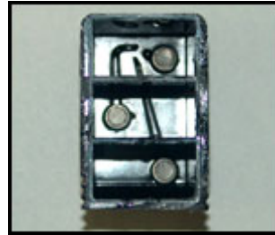
Cartuccia senza tappo e spugne Notare i condotti sul fondo della cartuccia...