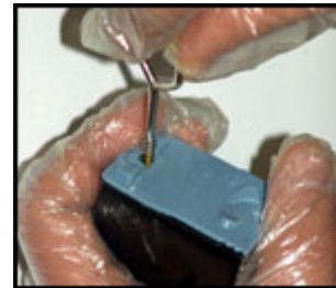
Effettuazione di uno dei tre fori per la ricarica diretta