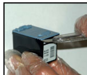
Rimozione tappo con taglierino