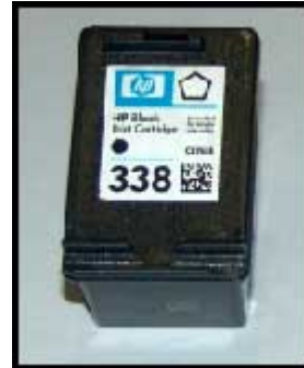
cartucce modello *336* *337* *338*

C9362E **336** (bassa capacità - 5 ml) C9364E **337** (bassa capacità - 11 ml) C8765E **338** (bassa capacità - 11 ml) C8767E **339** (alta capacità - 21 ml)