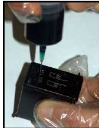
cartucce modello *336* *337* *338*