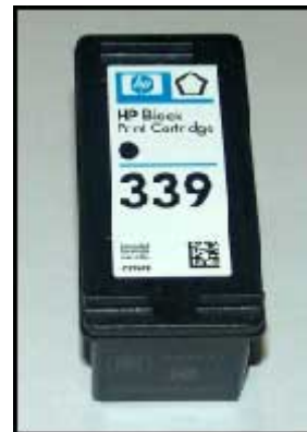
cartuccia alta capacità *339*

- Iniettare molto lentamente l'inchiostro necessario alla ricarica (da 10 a 20 ml).