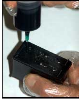
cartuccia alta capacità *339*