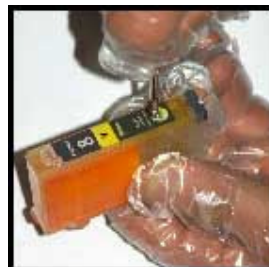
cartuccia NERO e COLORI "CLI8"