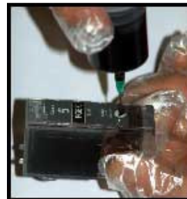
cartuccia NERO alta capacità "PGI5"