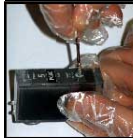
cartuccia NERO alta capacità "PGI5"

- Dopo aver forato la cartuccia con la siringa iniettare molto lentamente l'inchiostro necessario (da 8 a 20 ml in base al modello di cartuccia da ricaricare)